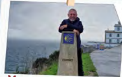
Vortrag Jakobsweg 07.09.23 | 19 Uhr