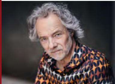
CLUB DER TOTEN DICHTER SOLO · 15.10.