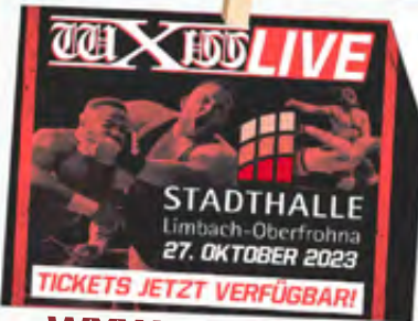
WXW Wrestling 27.10.23 | 20 Uhr