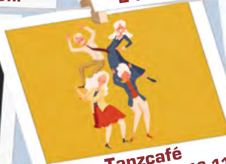
Tanzcafé 21.09. | 19.10. | 16.11.