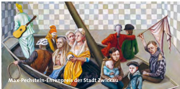
Max-Pechstein-Ehrenpreis der Stadt Zwickau