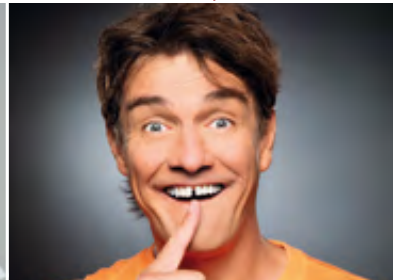
MATZE KNOP · 21.10.