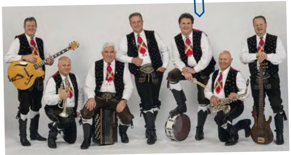
Die Kastelruther Spatzen – 40 Jahre! Das große Jubiläum am 17.11.2023, 19:30 Uhr in der Stadthalle Zwickau

07.02.2024, 20:00 Uhr, Sascha Grammel – Wünsch dir was