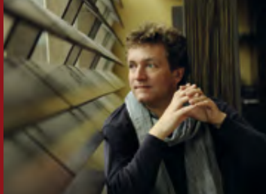
ITALIENISCHE! Festkonzert · 15.09.