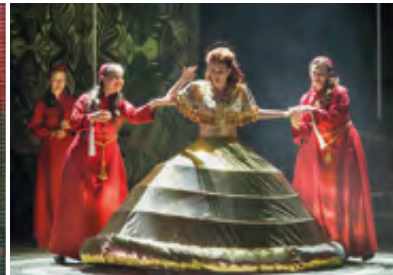
JOLANTHE Oper · 13.10.