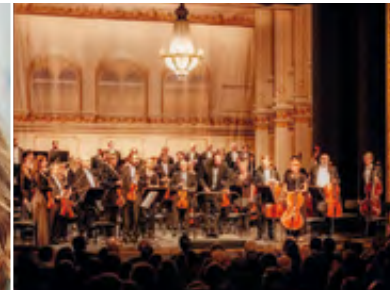
BRUCKNER-KONZERT · 03.10.