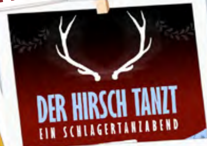
Ü40-Hirschtanz 04.11.23 | 20-01 Uhr