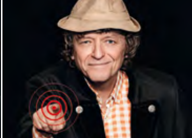
ERWIN PELZIG · 16.09.