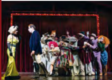
DIE ZIRKUSPRINZESSIN · 06.10.