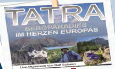
Vortrag Tatra 26.11.23 | 16:30 Uhr