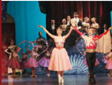
ASCHENBRÖDEL Ballett · 29.09.