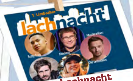
Lachnacht 19.11.23 | 19 Uhr