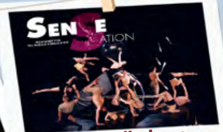
Artistikshow 07.10.23 | 15 & 20 Uhr