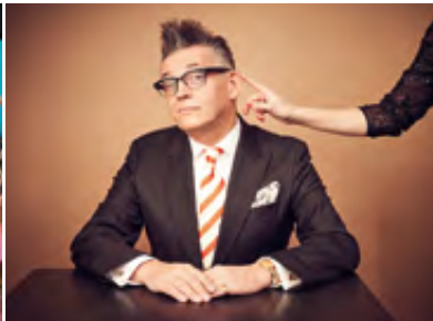
GÖTZ ALSMANN · 30.09.