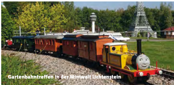
Gartenbahntreffen in der Miniwelt Lichtenstein