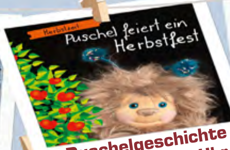
Puschelgeschichte 24.09.23 | 11 Uhr