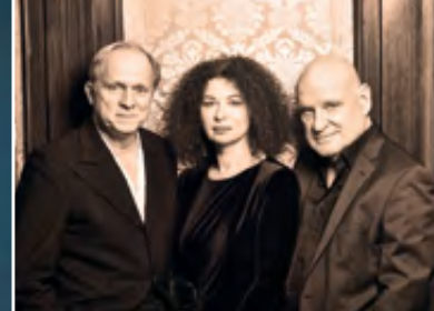
TUKUR & REDL · 23.09.