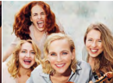
SALUT SALON · 01.10.