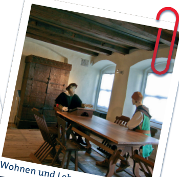
Wohnen und Leben im Mittelalter